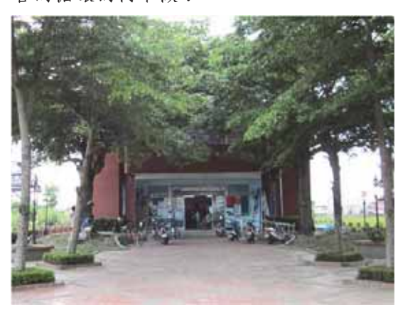
▲ 這裡是仕安里民活動中心,同時也是 社區合作社

一個事業體的產生,只靠著五、六個對社區有感的居民來說,這個負擔真的太重。在台南市社會局的輔導之下,廖育諒等人開始思考籌組社區合作社的可能性,透過居民認股,讓大家參與其中成為事業的夥伴,大家集思廣益、共同決策、共同承擔去創造更多的可能性。