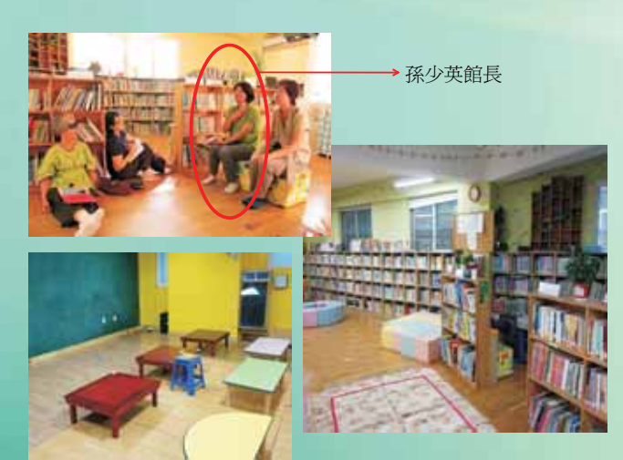
一切都從社區圖書館開始 -兒童教育、媽媽教育 Energy Coop in Seoul

The COOPERATIVE NEWS is published quarterly by the Co-operative League of the Republic of China, No. 11-2. Fu-chow St., Taipei Taiwan, R.O.C.