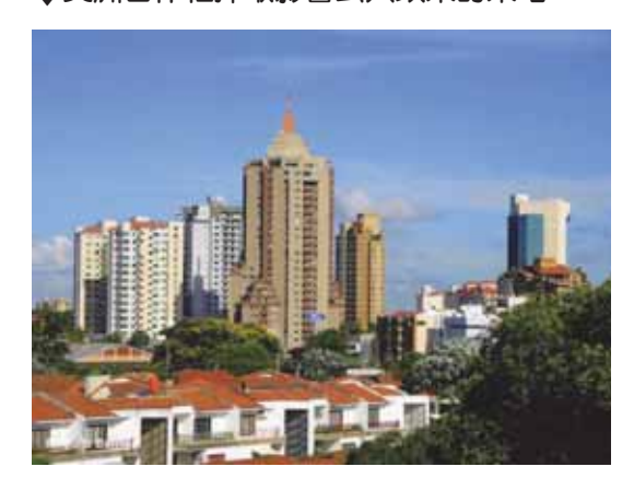
▲在玻利維亞東部大城 Santa Cruz 舉行會議。

美洲合作社行政議事會 (Administrative Council of Co-operatives of the Americas) 在玻 利維亞東部大城 Santa Cruz 召開的最後一