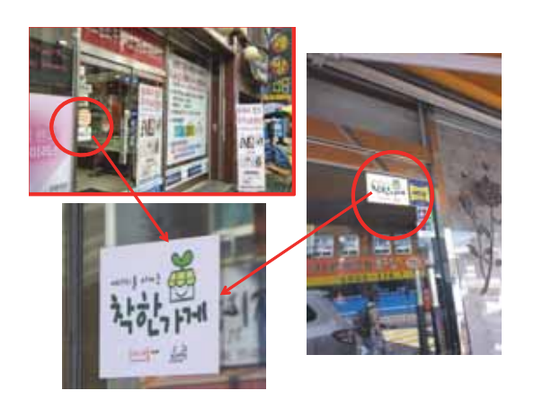
▲照片 4 組、社區商店參與與普及、節電標誌