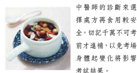
擇處方再食用較安 全。切記千萬不可考 前才進補,以免考場 身體起變化將影響 考試結果。

物,必需依照個人體質來選擇處方, 通常體質太虛不宜進補, 過於燥熱時 反會上火。特別是考生情緒不穩腸胃 更趨敏感,稍微油膩燥熱都會引起腸 胃不適甚或影響睡眠。建議最好經過