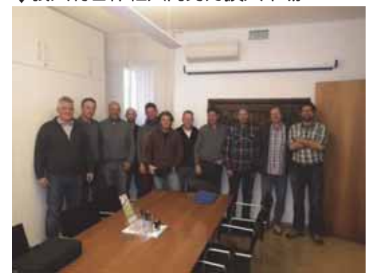
兩家義大利農業合作社正在一起努力 開發新市場、Apofruit Italia和Bio Meran