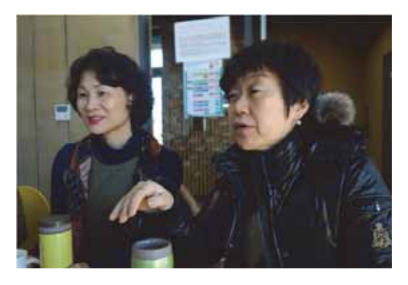
▲照片 5 組、合作社公告的資訊、青年開會、媽媽顧問團