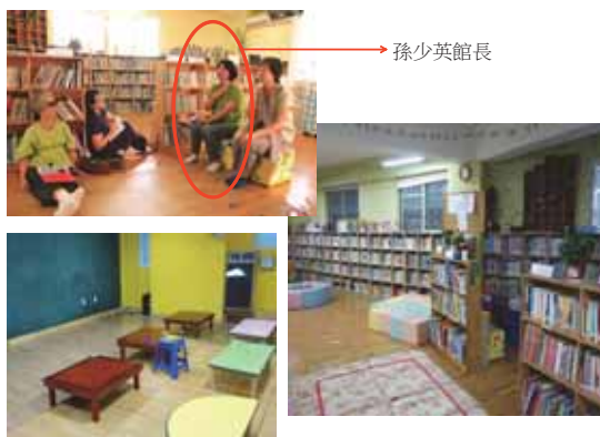
▲照片 2 組、一切都從社區圖書館開始 - 兒童教育、媽媽教育