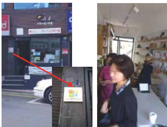
▲照片 1 組、首爾銅雀區能源合作社、能源超市、市政府能源科科長