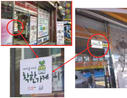
▲照片 4 組、社區商店參與與普及、節電標誌