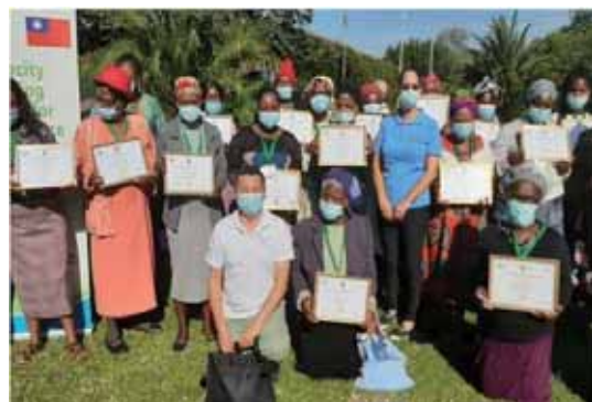
圖 3 婦女微額金融機構能力建構計畫學員取得證照