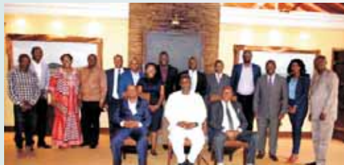
▲Oriyomi Ayeola先生當選國際合作社聯盟非洲區委員會第三任主席