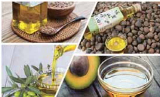
圖 4 好油種類

油脂還是人體所需的營養素，多選用單元不飽和脂肪酸（W-9 脂肪酸），可以幫助腸胃道正常膽汁分泌，避免胰臟工作量增加。還可以維持細胞膜磷脂質的通透性，讓細胞機能正常減少癌變。因此適當用好油來烹調也是重要的。橄欖油、苦茶油、芥花油、酪梨油、亞麻仁油都可適量選用。