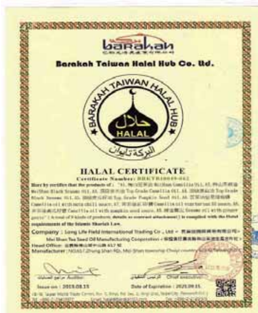
圖 3 巴勒克清真產業有限公司清真食品認證