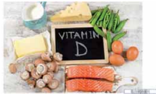
圖 5 維生素 D 食物

曬，並多攝取含維生素 D 豐富的食物。如：牛奶、起司、深海魚、乾香菇、乾木耳等。