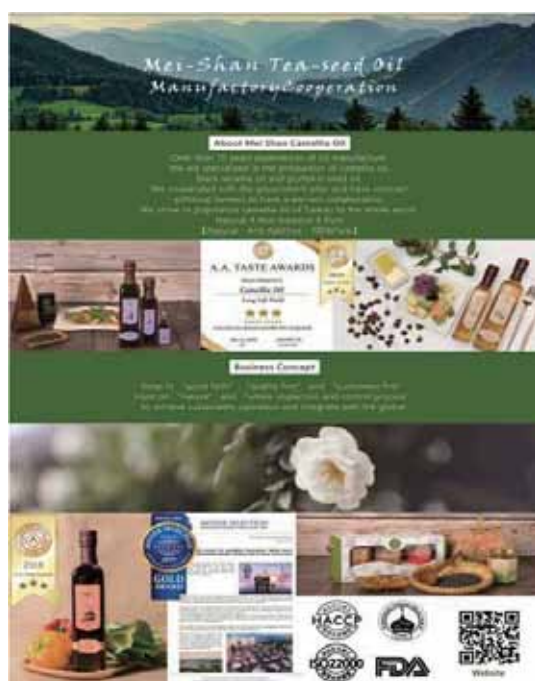
圖 6 英文版海報