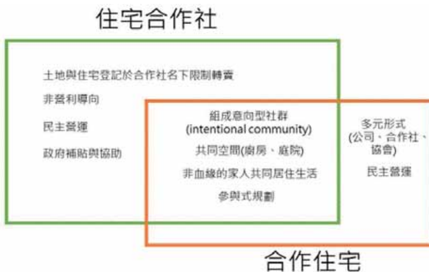
圖 2 住宅合作社與合作住宅之比較