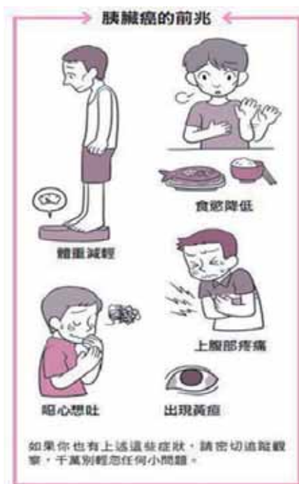
圖 1 胰臟癌前兆