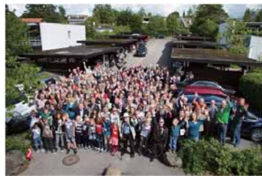
圖 1 丹麥 Sættedammen 社區，為國際公認第一個合作住宅社區，運作迄今。

不同於市場住宅與社會住宅，合作住宅是先找人（組織社群）再有房子。世界公認的第一個合作住宅，是丹麥哥本哈根 Sættedammen 社區，由 50 個秉持共同兒童教養理念的家庭，於 1972 年籌組興建。其後此居住模式逐步拓展至歐洲（北歐、德國等）、美洲（美國、加拿大）、亞太（澳洲、日、韓）等，並持續發展中。