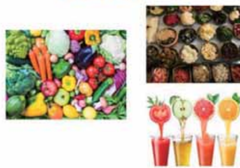
圖 3 選擇新鮮蔬果少加工