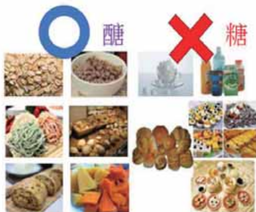
圖 2 含糖食物