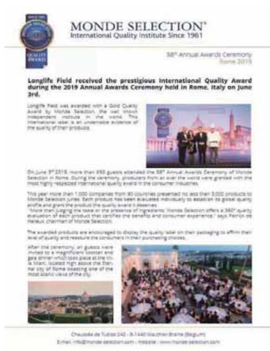
圖 5 2019 年榮獲義大利 Monde selection 金賞獎報導