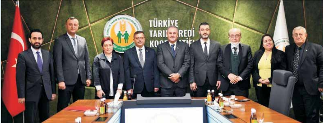
▲國際合作社聯盟與糧食及農業組織在土耳其聯合舉辦的會議中探討合作社應對糧食安全挑戰之解決方案