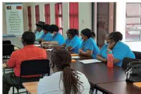
圖 2 婦女微額金融機構能力建構計畫學員之學習狀況

都在推廣合作社，合作社被認為是經濟的驅動力之一，顯示合作社在非洲國家經濟發展中，扮演相當重要的角色。目前臺灣國際合作發展基金會，透過技術團在史瓦帝尼開展了以基層鄉村婦女為重點的婦女微額金融機構能力建構計畫，選定當地鄉村婦女創業者 and 鄉村 SACCO 進行能力建構，提升其競爭力，相信對協助其永續發展有相當大的效益。