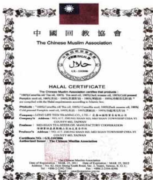
圖 1 中國回教協會清真食品認證