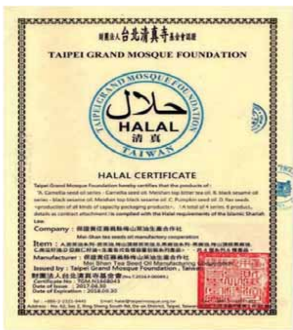
圖 2 台北清真寺清真食品認證