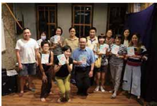
圖 3 合作宅一起巡迴放映，截至 2021 年 9 月，已撥放超過 25 場 (700 人次) (資料來源：OURs)