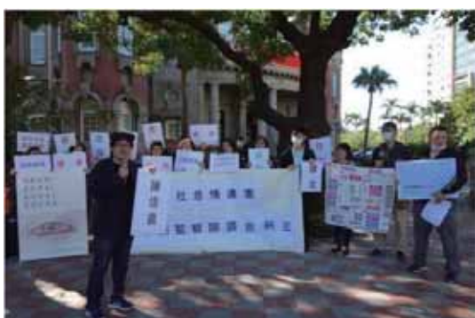
圖 4 推展合作社怠惰違憲，要求監察院調查糾正記者會