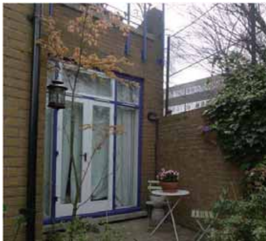
圖 1 住宅合作社內部一隅。

包容成就了社區的千姿百態，Abeona 肯定是百花齊放中的一朵，而奉行民主平等不墜的 Abeona，如其名地使懷抱中的住客安居度日，歲歲年年。