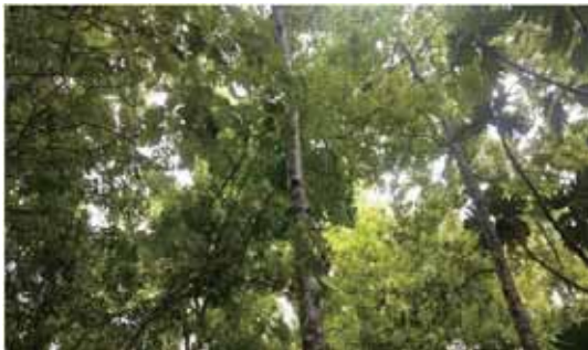
圖 4 有限責任水璉林業運銷合作社利用短伐期楓香，作為段木香菇用材發展林下經濟。

加工利用。楓香造林木徑級已達可利用階段，可供作段木香菇培植利用，並且依段木香菇培植試驗結果，合作社有條件繼續經營，未來 5 年將利用現有菇場設備搭配疏伐之楓香進行香菇生產工作。透過疏伐撫育作業培育大徑木生長，並從中取得短伐期之楓香作為林下經濟一段木香菇之用材（圖 4），且透過林業合作社推廣疏伐木、林下經濟副產物的產銷及舉辦相關活動，提升林農收益。本區透過林業合作社結合周遭居民，在不破壞自然環境且共榮的環境下，以林下經濟作物提升周邊林農收益，並藉此舉辦相關推廣活動，使民眾更加了解林農之生活，且深刻體會山村經濟發展。