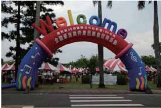
圖 1 活動入口意象