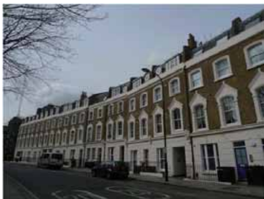
圖 2 住宅合作社外觀。