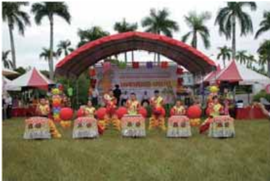
圖 4 現場活動表演-戰鼓迎賓與雙獅呈祥