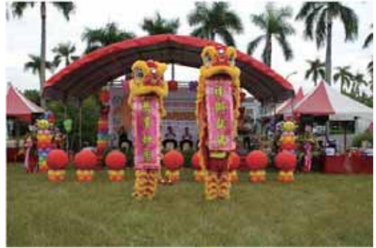
圖 5 現場活動表演-祥獅獻瑞