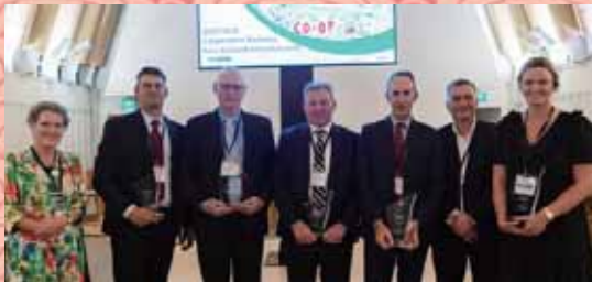
▲紐西蘭合作社企業年度獎項頒獎