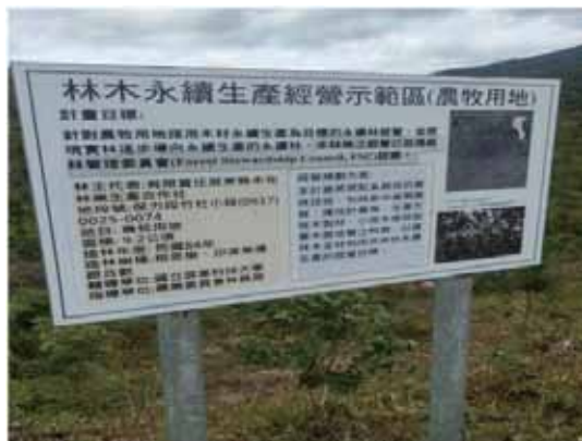
圖 5 有限責任屏東縣永在林業生產合作社 2016 年通過 FSC FM (森林管理) 驗證，以符合國際永續森林經營原則的方式經營人工林，以林木全材利用做成木屑太空包。

多雨，冬季則有強勁的落山風，為達到鏟除銀合歡而更新林相，合作社初期之林產物加工以生產原木及木屑為主，為減少伐採後林木的運輸成本及顧及交通便利性，更新造林部分將採用密植，可加速林地的鬱閉，抑制土壤中銀合歡種子庫的發芽及雜草生長，減少刈草次數，除可降低幼齡木在刈草過程中的耗損，也可增加林木間的高生長競爭，盡量減少側枝產生，提高木材品質。