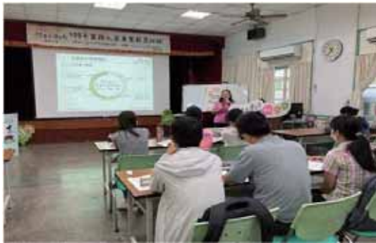
圖 2 林務局成立政策服務單一窗口，經由全台業務人員專業教育訓練及巡迴說明會，加速政策落實推動。