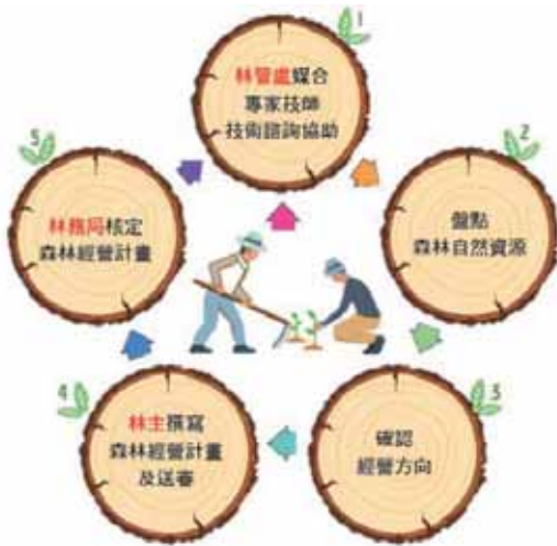
圖 1 林務局為積極輔導林主與合作社，已成立專業團隊及林業技師以協助林主規劃人工林的多元經營方式，並撰擬「森林經營計畫書」，實施計畫性的經營。