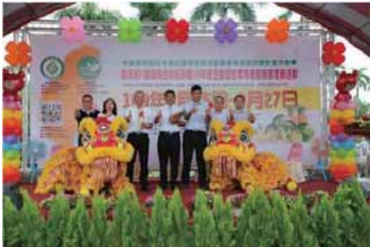
圖 2 各級長官及貴賓蒞臨活動會場指導