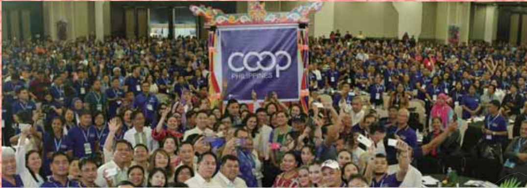
▲菲律賓參議院通過合作社發展辦公室(CDO)法案