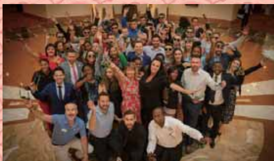
▲世界青年儲互社專業人員計畫(WYCUP) 滿20周年慶祝