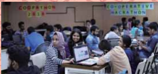
▲合作松3.0 (Coopathon 3.0) 於2020年12月11日至14日舉行