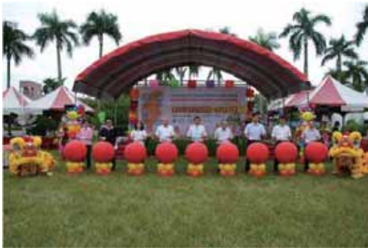
圖 3 各級長官及貴賓蒞臨活動會場剪綵