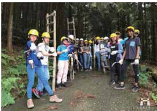
圖 3 有限責任嘉義縣阿里山林業合作社利用森林資源經營森林療癒，推廣工作假期體驗課程。

5. 合作社預計進行林下經濟發展的初步建置，期望藉由提升合作社林農收益，使森林經營有利可圖。經營項目預計為金線連產業發展與段木香菇產業發展兩部分。