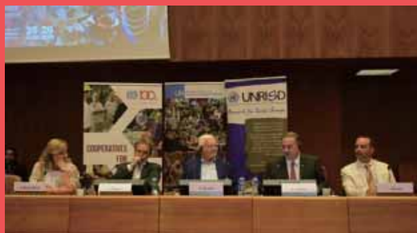
▲國際合作社聯盟主席受邀至聯合國會議發表演講。