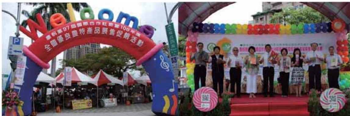
▲第一組照片：開幕式（左）、各級指導長官與貴賓合影（右）。