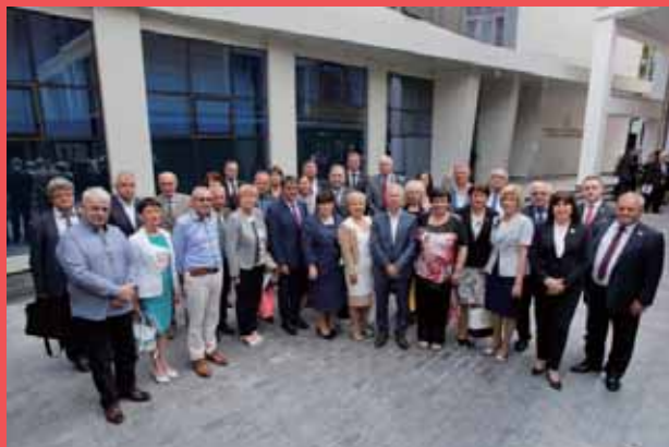
▲國際合作社聯盟主席參訪東歐及其合影。