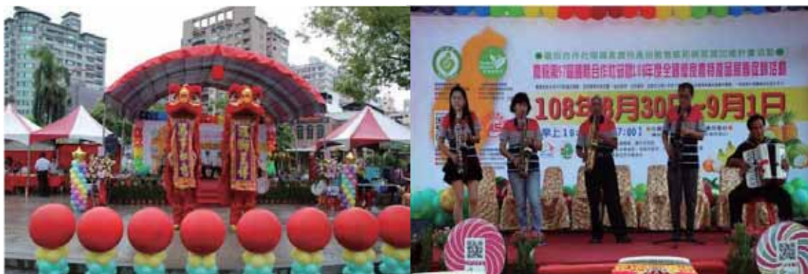
▲第三組照片：現場活動表演。