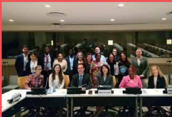
▲2019年在紐約聯合國總部舉行的國際合作社日慶祝活動。