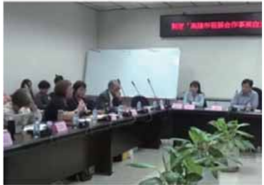
▲高雄市發展合作事業自治條例公聽會。