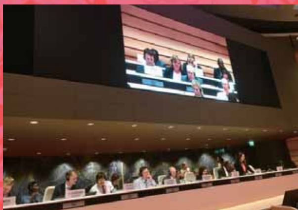
▲國際合作社聯盟出席國際勞工組織第108屆會議。