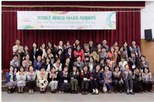
▲台日韓三國姊妹會：2018 年以能源為主題，在韓國「首爾中部女性發展中心」召開大會。

1999 年底，日本生活俱樂部生協連合會、韓國女性民友會生協與主婦聯盟環境保護基金會（後續由本社承接締約）三個組織在東京締結為「亞細亞姊妹會」，並每年輪流舉行年會，除合作社七大原則實踐討論外，更共同延伸訂定第八原則「創造替代性的永續社會」，以消費合作社為主體關注食物、能源和照護（F E C 自給圈）議題。透過與日韓姊妹的交流拉高我們看待合作運動的視野，也看見善用合作社這個生活工具所帶來的更多可能。