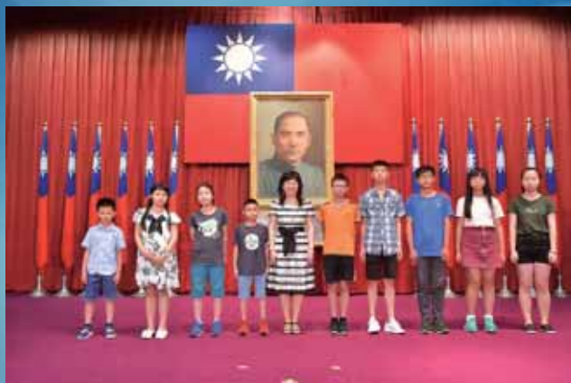
▲第97屆國際合作社節活動頒獎：合作事業繪畫比賽優勝獎項