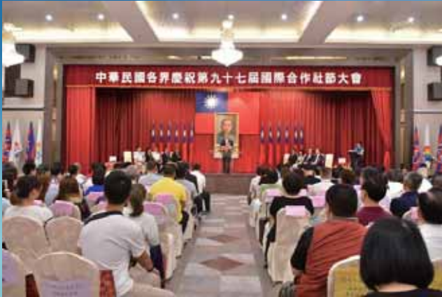
▲第97屆國際合作社節大會現場與會盛況