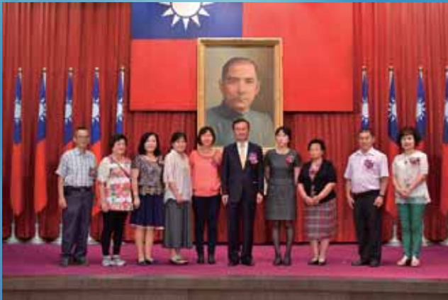
▲第97屆國際合作社節活動頒獎：績優合作社運動推廣人員獎項