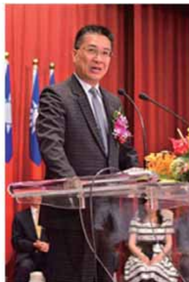
▲內政部徐部長國勇先生

為了慶祝國際合作社節，先前已分別舉辦合作社微電影徵選比賽、繪畫比賽，皆將在今天頒獎，因此除了成人外，現場