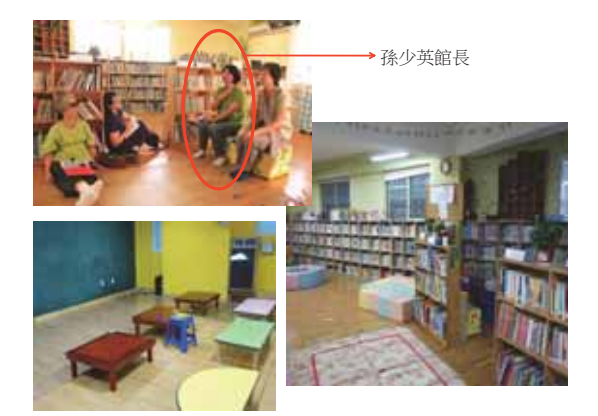
▲照片 2 組、一切都從社區圖書館開始 -兒童教育、媽媽教育