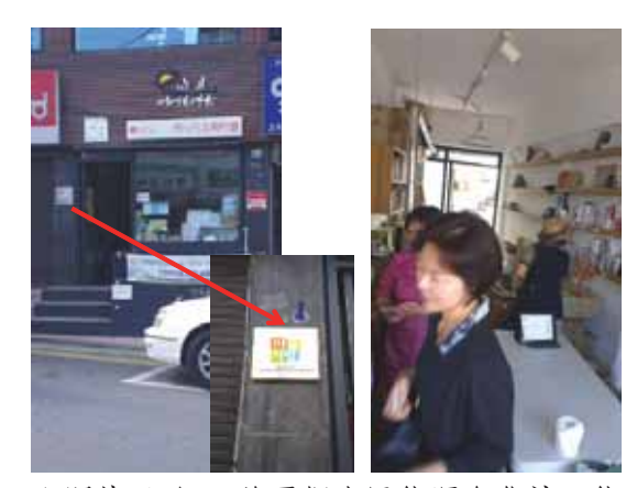
▲照片 1 組、首爾銅雀區能源合作社、能 源超市、市政府能源科科長