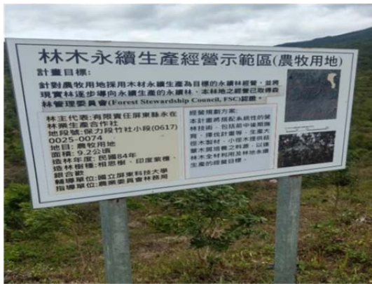
圖 5 有限責任屏東縣永在林業生產合作社 2016 年通過 FSC FM（森林管理）驗證，以符合國際永續森林經營原則的方式經營人工林，以林木全材利用做成木屑太空包。

多雨，冬季則有強勁的落山風，為達到鏟除銀合歡而更新林相，合作社初期之林產物加工以生產原木及木屑為主，為減少伐採後林木的運輸成本及顧及交通便利性，更新造林部分將採用密植，可加速林地的鬱閉，抑制土壤中銀合歡種子庫的發芽及雜草生長，減少刈草次數，除可降低幼齡木在刈草過程中的耗損，也可增加林木間的高生長競爭，盡量減少側枝產生，提高木材品質。