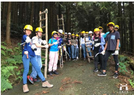
圖3 有限責任嘉義縣阿里山林業合作社利用森林資源經營森林療癒，推廣工作假期體驗課程。

5. 合作社預計進行林下經濟發展的初步建置，期望藉由提升合作社林農收益，使森林經營有利可圖。經營項目預計為金線連產業發展與段木香菇產業發展兩部分。