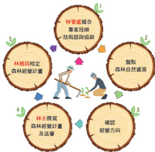
圖 1 林務局為積極輔導林主與合作社，已成立專業團隊及林業技師以協助林主規劃人工林的多元經營方式，並撰寫「森林經營計畫書」，實施計畫性的經營。