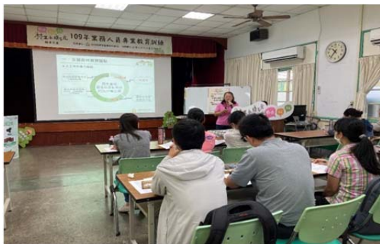
圖 2 林務局成立政策服務單一窗口，經由全台業務人員專業教育訓練及巡迴說明會，加速政策落實推動。