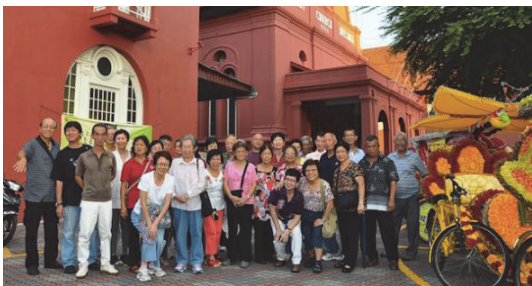
▲銀色水平旅遊合作社社員某次出遊照片。

合作社正在協助改善新加坡年長公民的生活品質，它們從就業、保健到旅遊提供一系列的服務。