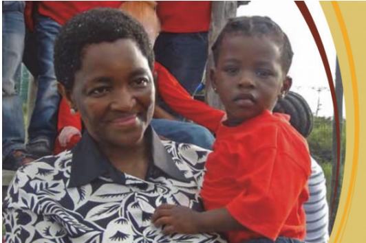
▲南非社會發展部部長 Bathabile Dlamini

南非社會發展部部長 Bathabile Dlamini 計畫利用社區型合作社對抗伊麗莎百港馬勒維爾 (Motherwell, Port Elisabeth) 地區缺乏就業機會的問題。該地區多數婦女都是無法照顧家庭的失業單親母親，成立合作社能夠幫助她們取得穩定的收入來源。