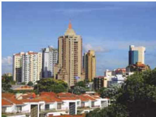
▲在玻利維亞東部大城 Santa Cruz 舉行會議。

美洲合作社行政議事會 (Administrative Council of Co-operatives of the Americas) 在玻利維亞東部大城 Santa Cruz 召開的最後一