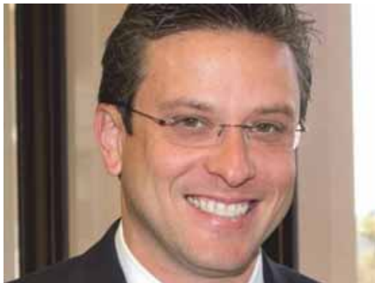
▲波多黎各總督 Alejandro García Padilla

波多黎各總督 Alejandro Garcia Padilla 簽署一項法案，讓信用與儲蓄合作社適用新會計原則。波多黎各陷入為期長達十年的經濟衰退以及面臨嚴重的財政危機，新法案的目的在強化合作社財務狀況，讓合作社不會因為政府公債貶值而受害。