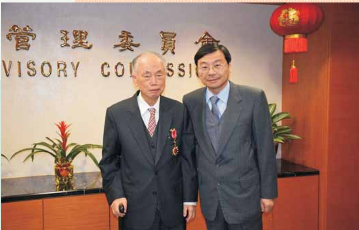
本會黃名譽理事長澤青獲金管會曾主任委員銘宗頒發一等金融專業獎章並合影