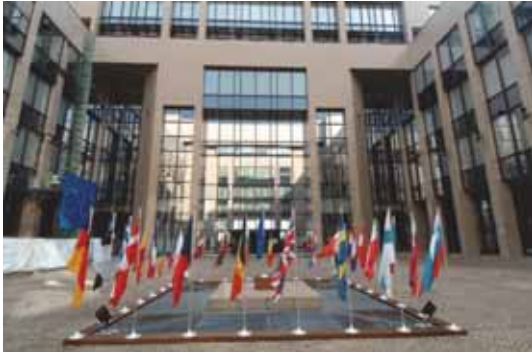
▲ 歐盟議事會和歐洲議事會。

歐洲合作社(Cooperative Europe)歡迎歐洲議事會(European Council)採用推動社會經濟的結論，早在 2015 年 12 月 7 日為歐洲部長(European Ministers)會議所接受的這一份文件，認可合作社和其他社會事業在達成歐盟的關鍵性目標中所扮演的角色。(譯者註：歐盟由立法機構(歐洲議會和歐洲議事會)、行政機構(歐盟委員會)及司法機構(法院)所組成，歐盟機構的權力建立在會員國批准的條約上，條約未規範的部分會員國政府可行使其主權。歐洲議事會由會員國政府領袖組成，這是每年集會四次的高峰會，目的在確認政策的優先順序，採行共識決。)