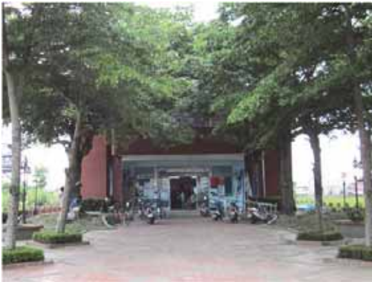
▲ 這裡是仕安里民活動中心，同時也是社區合作社

在推行社區福利的認為政府及外界的捐款皆無法讓社區福利持久的推廣下去... 在這因緣際會之下，有人提出由社區自己籌組一個經濟事業體，透過種植無毒米，跟社區內的小農契作，用高價向他們收購，保障小農的收入；同時透過這個事業體的結餘來去支付、推廣社區福利。小農、社區兩者都照顧到，同時讓消費者吃到健康的無毒米，如此良善的循環為何不做？