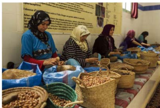
▲2014年2月7日摩洛哥Essaouira地方婦女在有機水果生產合作社工作。

聯合國經濟暨社會事務部(United Nations Department of Economic and Social Affairs, UNDESA)與聯合國人類住區規劃署(UN Habitat)共同組成專家團隊檢視合作社在永續發展中的經驗，這一個團隊在肯亞首都奈洛比(Nairobi)集會進行研討。研討會參與者檢視合作社在永續發展中所扮演的角色，評估它們的