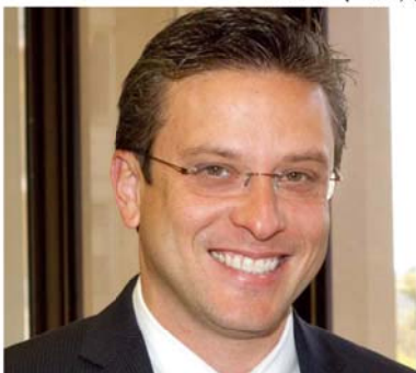
▲波多黎各總督Alejandro García Padilla

2014年10月23日波多黎各總督Alejandro García Padilla簽署一項新法案，這一項稱為2014年101法案(Law 101 of 2014)將協助波多黎各合作社取得資金以支應業務發展和規模擴張。