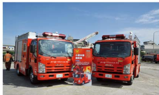
創立 100 週年社慶贈與新竹市政府消防局雙艙水箱消防車 2 輛。

民分社並於八十九年十二月購置總社隔鄰之土地與建物以擴充營業場地，八十一年五月十八日城東分社完成整修遷回原址營業，七月二十九日起於三民分社開辦保管箱業務，同年九月二十九日竹北分社擴建整修完工，十月七日起開辦金資連線跨行通匯業務、自動提款機跨行啟用，陸續於總分社及各據點設置自動提款機，八十二年三月二十二日起於竹北分社、東南分社及南寮分社陸續開辦保管箱業務，八十六年五月十六日開辦自動櫃員機跨行轉帳業務，八十七年設立二十四小時自動化服務區，八十八年開辦外幣現鈔買賣業務，八十九年開辦綜合存款業務，九十二年開辦金融卡融資業務滿足客戶需求。