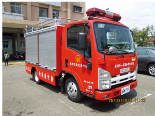
創立 100 週年社慶贈與新竹市政府消防局小型消防車 1 輛。