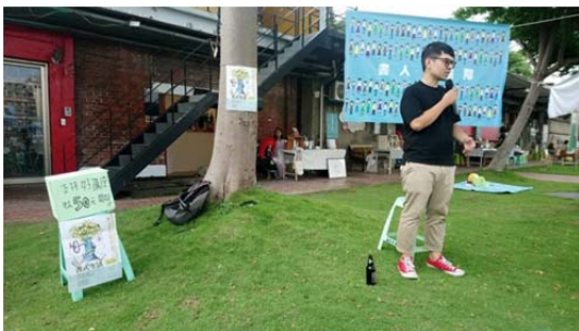
圖 3 嘉義「書式生活」的舒適建立在友善串連合作的基礎上，讓人對於書店經營的多樣性有更多的想像。

就近幫我收送貨。當然「閱讀的島」刊物讓獨立書店的各個面向被看見，專案計畫和出版社、文化部門、創作者協力，體諒因為新冠肺炎疫情可能造成社員財務衝擊主動推出的繳款方案，並且經常提供相關資訊讓社員們第一時間掌握先機、以及推出專屬的聯合行銷計畫，還有專門針對獨立書店營運開發的友善書業 POS 系統等，在友善書業合作社裡我看見愛書人之間的互助，是獨立書店的強大後勤，支持著閱讀更支撐了價值。