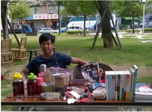
圖 1 字奕書箱的招牌很小因為要攜帶方便，這是帶著當時就讀國中的兒子參加市集擺攤的畫面，現在已經大學三年級的他選擇社會科學領域持續參與。