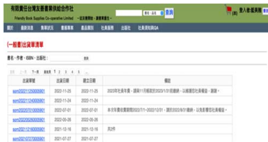
圖 7 每個社員有專屬的帳號密碼，登入合作社訂書系統便可以獲得所需資訊，另外，合作社開發的 POS 可以與本系統串接，對於書店的進出貨及庫存狀況掌握有所幫助。

參與友善書業合作社的發現實在不容易用幾千字來描繪，而自己的獨立書店經營經驗又太過淺薄，但或許正是因為這樣我才更覺得想以個人的看見來寫下本文，畢竟這是親身投入過的歷程，走在創業路難免顛簸崎嶇但沿途風景總是迷人。