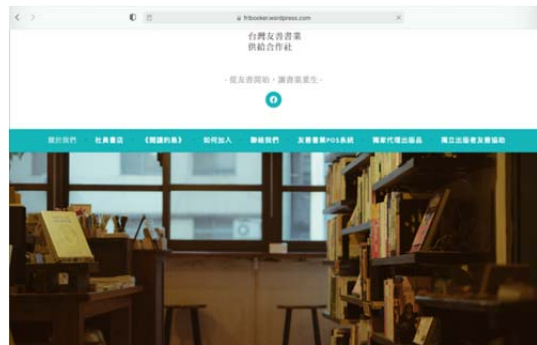
圖 4 台灣友善書業供給合作社官方網頁，歡迎上網搜尋。

關於友善書業合作社，官網（ https://fribooker.wordpress.com ）有詳細的介紹，「從友善開始，讓書業重生」是針對出版產業飽經折扣割喉戰摧殘，從出版社、經銷商、書店哀鴻遍野，卻無計可施的現象尋找解決辦法，在 2014 年底由台灣多家獨立書店集結共組，試圖以社會企業作公益經銷，眾人合作為解決書業困境的公共實驗邁出一步，持續推動出版產業的良性競爭，並打破現有圖書經銷區域不均衡發展的現況。