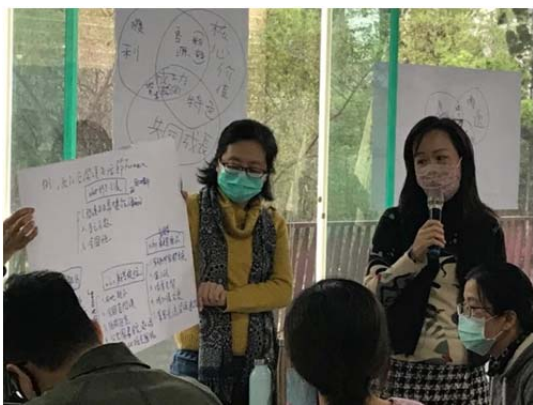
圖 6 2021 年社員大會邀請作家洪震宇引導社員們分組討論，大家集思廣益共同為獨立書店的未來一起想辦法。

翔，愛看書的孩子不用盯功課，與書為友真的天長地久。謝謝友善書業合作社，讓我可以勇敢地圓夢，並且認識更多志同道合的朋友。