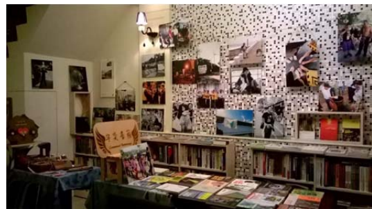
圖 8 由於是接手朋友原先經營的咖啡館，如何利用既有空間加入書店元素及策展，確實不容易，這一年半在這小小空間裡，許多有意義的事情在此發生，我真的賺到了。2016 年 4 月搭配能源議題在書店策主題書展，透過友善書業合作社訂書可以取得不同出版社的專書，解決很多問題。

語意、羽翼、與藝、予益、嶼議……，「宇奕書箱」似乎又可以飛了，下一站要到哪裡呢？就等候那一條看不見的線牽引我到美麗之島一隅，展開閱讀的翅膀盡情遨遊翱翔。