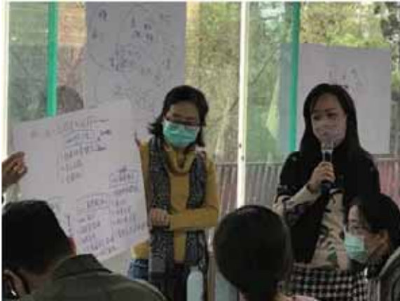
圖 6 2021 年社員大會邀請作家洪震宇引導社員們分組討論，大家集思廣益共同為獨立書店的未來一起想辦法。

翔，愛看書的孩子不用盯功課，與書為友真的天長地久。謝謝友善書業合作社，讓我可以勇敢地圓夢，並且認識更多志同道合的朋友。