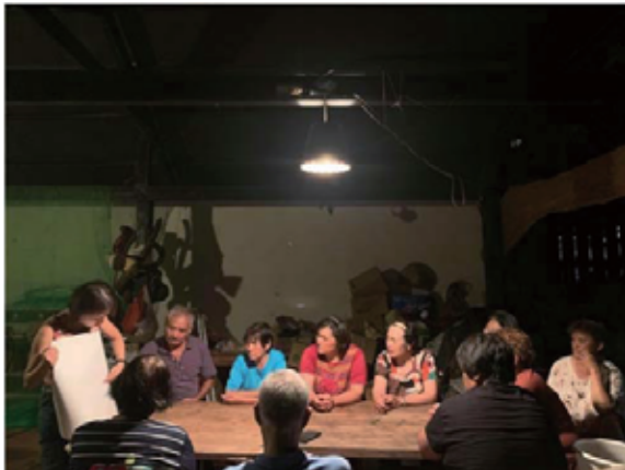
圖 2 合作社籌辦期間辦理社員教育