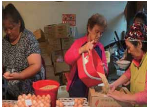
圖 4 社員每週共同參與理蛋作業