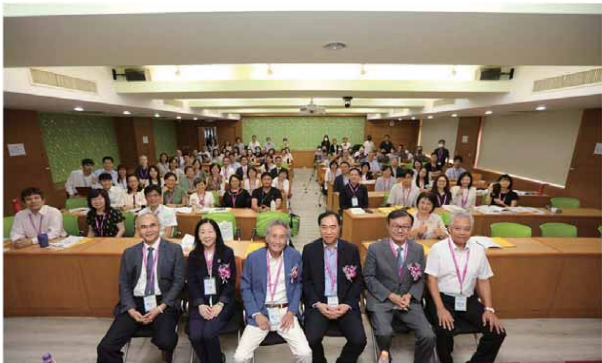
第 101 屆國際合作社節「合作事業發展研討會」大合照