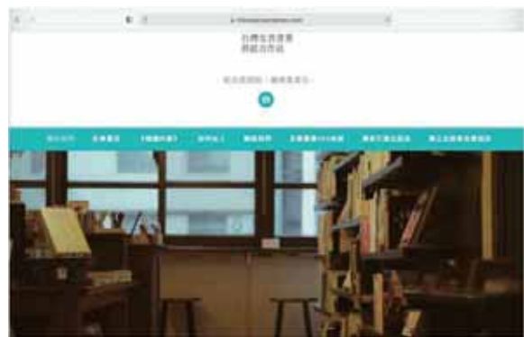
圖 4 台灣友善書業供給合作社官方網頁，歡迎上網搜尋。

關於友善書業合作社，官網（ https://fribooker.wordpress.com ）有詳細的介紹，「從友善開始，讓書業重生」是針對出版產業飽經折扣割喉戰摧殘，從出版社、經銷商、書店哀鴻遍野，卻無計可施的現象尋找解決辦法，在 2014 年底由台灣多家獨立書店集結共組，試圖以社會企業作公益經銷，眾人合作為解決書業困境的公共實驗邁出一步，持續推動出版產業的良性競爭，並打破現有圖書經銷區域不均衡發展的現況。