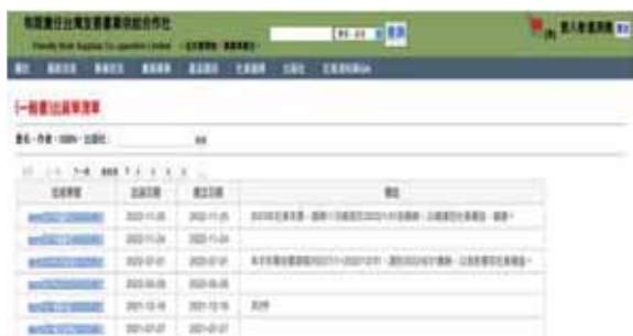
圖 7 每個社員有專屬的帳號密碼，登入合作社訂書系統便可以獲得所需資訊，另外，合作社開發的 POS 可以與本系統串接，對於書店的進出貨及庫存狀況掌握有所幫助。

參與友善書業合作社的發現實在不容易用幾千字來描繪，而自己的獨立書店經營經驗又太過淺薄，但或許正是因為這樣我才更覺得想以個人的看見來寫下本文，畢竟這是親身投入過的歷程，走在創業路難免顛簸崎嶇但沿途風景總是迷人。