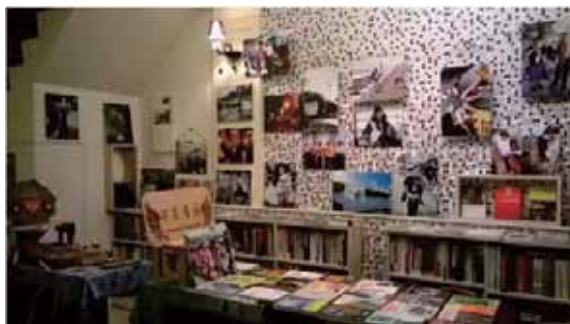
圖 8 由於是接手朋友原先經營的咖啡館，如何利用既有空間加入書店元素及策展，確實不容易，這一年半在這小小空間裡，許多有意義的事情在此發生，我真的賺到了。2016 年 4 月搭配能源議題在書店策主題書展，透過友善書業合作社訂書可以取得不同出版社的專書，解決很多問題。

語意、羽翼、與藝、予益、嶼議……，「字奕書箱」似乎又可以飛了，下一站要到哪裡呢？就等候那一條看不見的線牽引我到美麗之島一隅，展開閱讀的翅膀盡情遨遊翱翔。