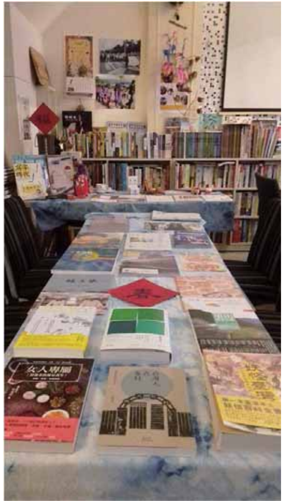
圖 5 2017 年 1 月因為訂書未達門檻請三餘書店協助收貨，感謝尚樺特地幫我帶來書店。

在我營運書店期間(2015/11~2017/04 為接手朋友在左營的咖啡館加入書店元素的獨立空間，2018/05~2020/09 在鹽埕區與旅店合作採低度營運)，因為會辦理講座、主題書展需要快速大量進書，可以註明是活動用書以便加快處理訂單；隨著訂單內容一起寄送來的還有藝文活動宣導品或是只送不賣的刊物；偶爾有客人詢問比較急著要拿到的書可以尋求同樣是社員的同業先調貨；一起集單加速向出版社下單的進度、只提供給合作社獨家代理或販售的出版品讓我直接電話，會員大會後出版社的報品、合作方案發布、和社員們的對話都是充電。