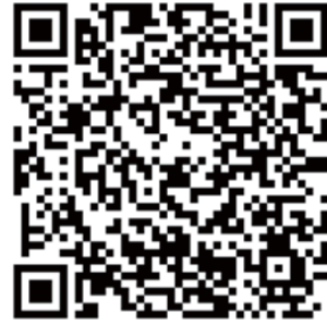
「2023 合作事業發展研討會」網站 QR Code

屆各位一同了解本次的內容。最後感謝中華民國各界慶祝第 101 屆國際合作社節籌備團隊所有成員在此次會議中的付出。