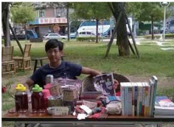
圖 1 宇奕書箱的招牌很小因為要攜帶方便，這是帶著當時就讀國中的兒子參加市集擺攤的畫面，現在已經大學三年級的他選擇社會科學領域持續參與。