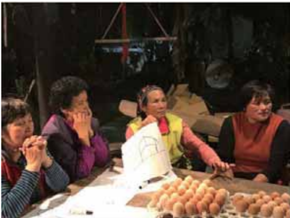
圖 1 社員提出簡易雞舍的使用問題與改善策略