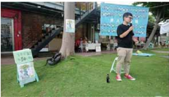
圖 3 嘉義「書式生活」的舒適建立在友善串連合作的基礎上，讓人對於書店經營的多樣性有更多的想像。

就近幫我收送貨。當然「閱讀的島」刊物讓獨立書店的各個面向被看見，專案計畫和出版社、文化部門、創作者協力，體諒因為新冠肺炎疫情可能造成社員財務衝擊主動推出的繳款方案，並且經常提供相關資訊讓社員們第一時間掌握先機、以及推出專屬的聯合行銷計畫，還有專門針對獨立書店營運開發的友善書業 POS 系統等，在友善書業合作社裡我看見愛書人之間的互助，是獨立書店的強大後勤，支持著閱讀更支撐了價值。