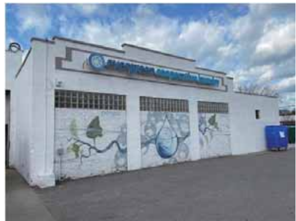
圖說：Evergreen Cooperative Laundry 廠房外貌

在科羅拉多州還有 Main Street Phoenix Workers Cooperative，2020 年成立之初就專注於在地餐廳，通過對工人提供資源和資金支持轉型為合作社，2021 年底成功完成 Griffin Coffee 的合作社轉型。該組織預估以五年時間透過收購或合作，協助 23 家餐廳轉型為合作社，除了 1,100 名員工可隨身份轉變而受惠，疫情期間也維持了社區的基本服務需求與發展。