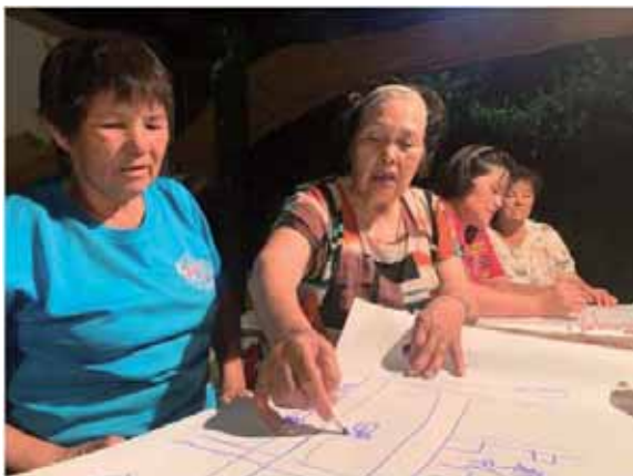
圖 3 利用 social mapping 進行工作坊提升社員彼此間的對話力