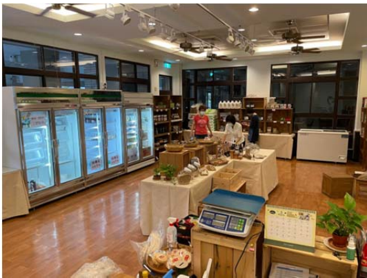
圖 2 合作社 2022 年已有較大的店面及外部可辦工作坊的場所

食在永續消費合作社的理念，是希望集結消費者的力量組成消費合作社，並藉此整合的消費力，支持在地小農、小生產者，組成生產合作社。並藉由兩者直接對接，形成「在地的循環經濟」。以下是支持部落長者自家放養雞，而組成部落蛋雞生產合作社的成功案例。