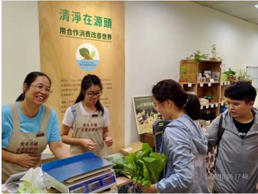
圖 1 食在永續消費合作社 2019 年最初成立的店面