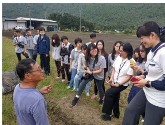
圖 5 慈濟大學師生實際參訪合作社供應商農場

生們也學習「設計思考」(Design Thinking)，透過「同理」、「釐清」、「發想」、「原型」及「測試」等五大步驟，培養學生實際解決農村問題的能力。