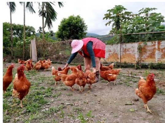
圖 3 紅葉部落老人飼養雞隻情況

紅葉部落合作，協助成立生產合作社推出部落老人福利蛋，提供部落產業發展所必要的現成市場（ready market）。此外，老人家們透過飼養雞群與雞群互動伸展活動筋骨，與雞隻互動的過程中，又能發揮「療癒」之效；目前生產合作社內的老人家，每天可以有一百多元的賣蛋收入，這對部落老人而言，是一份自給自足的收入，也不需要看年輕人的臉色。同時，由於慈濟大學食在永續消費合作社的陪伴，及東華大學 USR 團隊的合作，部落合作社也發展出獨特的品質管理方法，每顆雞蛋都有其獨特的編碼，讓消費者吃得安心的同時，也能夠清楚雞蛋的來源，知道是哪一戶人家生產，透過生產者溯源，可以更有效進行品質改善。