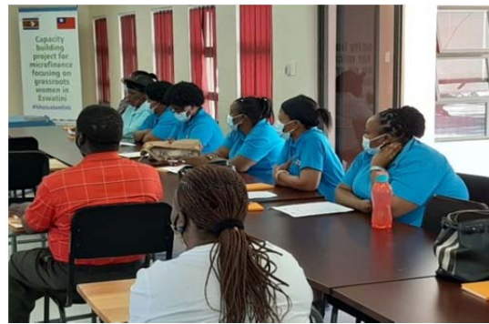
圖 2 婦女微額金融機構能力建構計畫學員之學習狀況

都在推廣合作社，合作社被認為是經濟的驅動力之一，顯示合作社在非洲國家經濟發展中，扮演相當重要的角色。目前臺灣國際合作發展基金會，透過技術團在史瓦帝尼開展了以基層鄉村婦女為重點的婦女微額金融機構能力建構計畫，選定當地鄉村婦女創業者和鄉村 SACCO 進行能力建構，提升其競爭力，相信對協助其永續發展有相當大的效益。