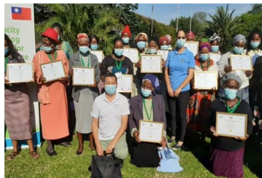
圖 3 婦女微額金融機構能力建構計畫學員取得證照