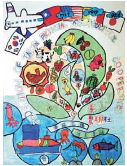
▲佳作/吳駿朋-台南市紅瓦厝國小