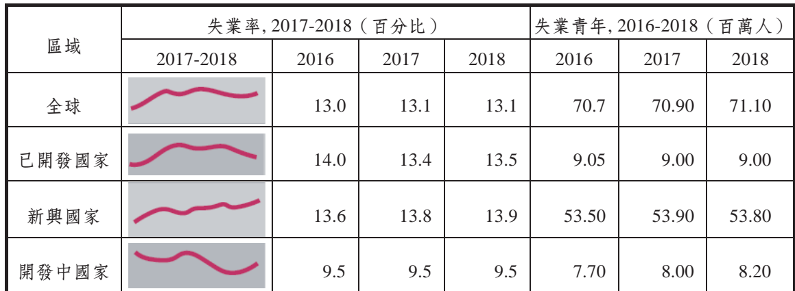
表 3 2016 - 2018 年國際勞工組織青年失業率