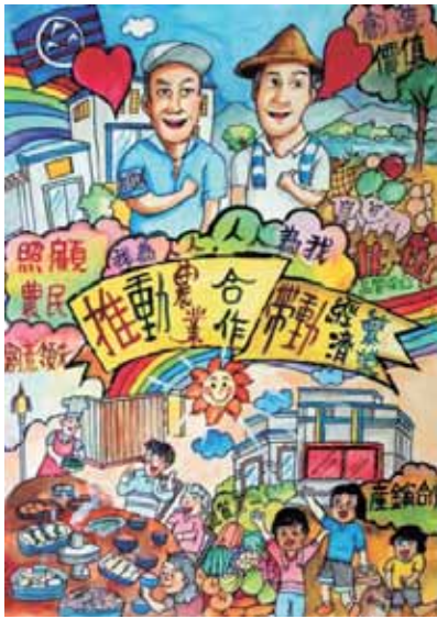
▲佳作/楊哲侑-高雄市正興國中