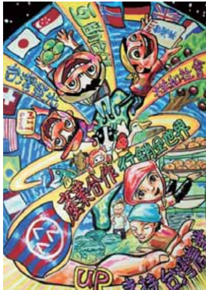
▲佳作/羅偉峻-台南市後甲國中