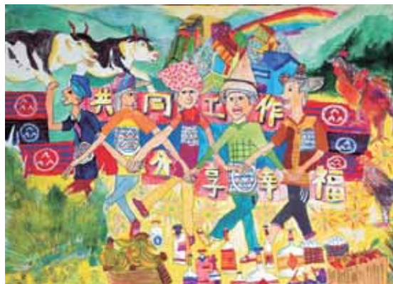
▲佳作/詹蒼澄-基隆市七堵國小