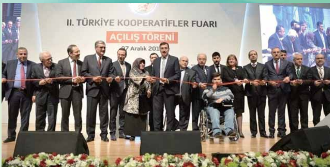
▲ 巴勒斯坦的合作博覽會

發行人：麥勝剛 Publisher：Shen-Gang Mai 總編輯：方珍玲 Chief Editor：Chen-Ling Fang 執行編輯：高毓璟 Executive Editor：Yu Ching Kao 發行所：中華民國合作事業協會 地址：台北市福州街11-2號2樓 電話：02-23219343 網址：clc-coop.tw E-mail：service@clc-coop.tw 內政部補助印行