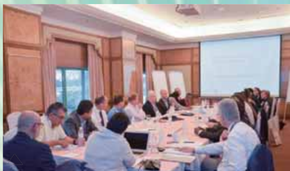
▲ 合作社發展委員會在吉隆坡的首次會議

行政院新聞局出版事業登記處 局版台誌字第3905號 中華郵政執照登記處 台北誌字第1547號雜誌