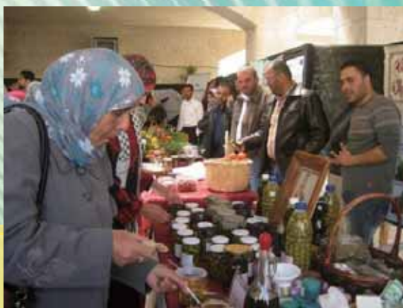
▲ 土耳其博覽會花絮