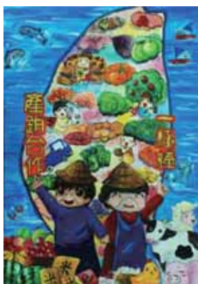
↑ 佳作/百依玲 (台中市中港高中-國中部)