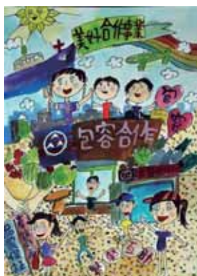
↑ 佳作 / 李佳容 (高雄市中正國小)