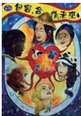
↑ 佳作/陳思廷 (台中市中港高中-國中部)