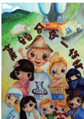
↑ 佳作/陳妍巨 (台中市中港高中-國中部)