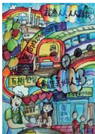
←佳作/姜藥好(高雄市中正國小)