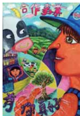
↑ 佳作/許崇威 (台南市建興國中)