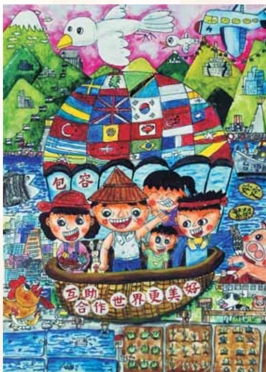
合作社節繪畫比賽優勝作品