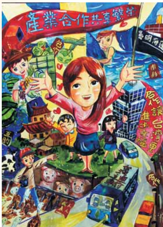
合作社節繪畫比賽優勝作品