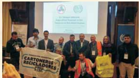
▲廢棄物回收工人參與ILO討論會