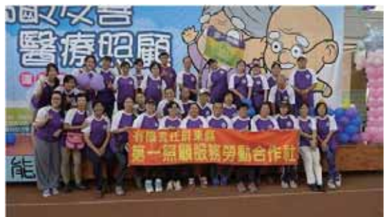
▲屏東縣第一照顧服務勞動合作社合照

既然「合作社」是這麼好的經濟制度，又是最典型的「共享經濟」模式，不解政府為何不大力推動，尤其是用在長照產業呢？