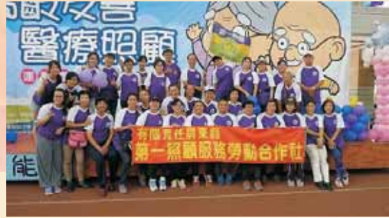
▲有限責任屏東縣第一照顧服務勞動合作社合照