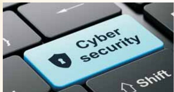
▲Hendricks電力合作社是NRECA的會員，目前將客製化自動系統運用在電力查核