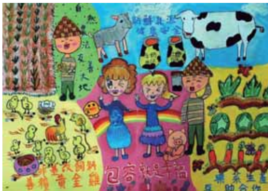
↑ 第一名 / 張斐薰 (雲林縣僑真國小)