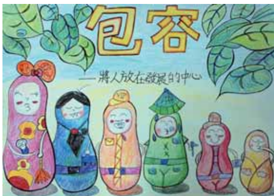
↑ 第二名 / 趙沛文 (花蓮縣萬寧國小)