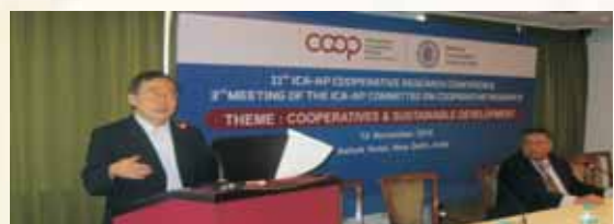
▲第11屆ICA-AP地區合作社研究研討會