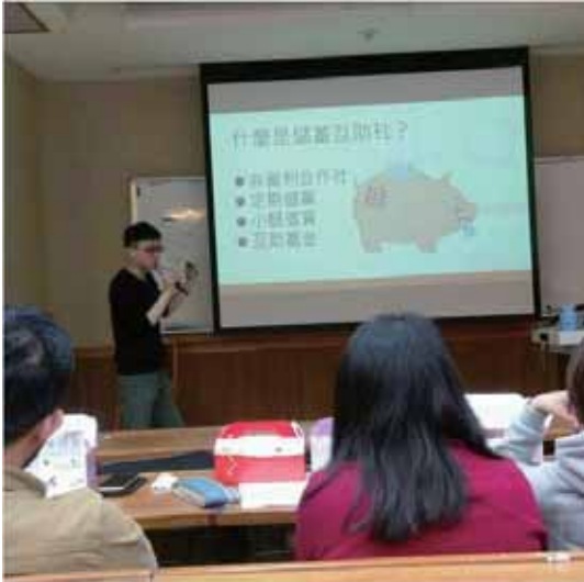
▲慈濟大學演講，介紹儲蓄互助社在大學校園的價值