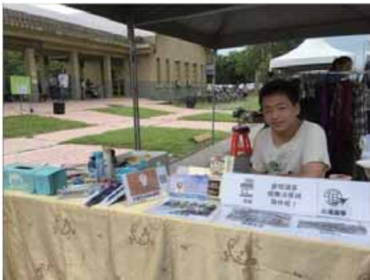
▲校園市集擺攤宣傳